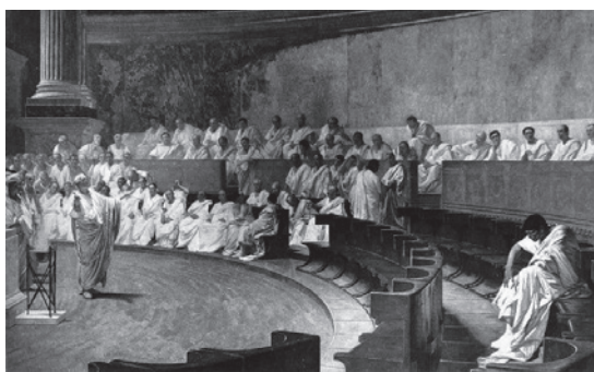
Figure 1: Cicero at his first speech against Catilina. Fresco of Cesare Maccari, 1888.

Racist speech in the Internet, structural racism in recruitment procedures, and racist stereotypes in advertising: racism occurs on many levels and is constantly being reproduced and updated through cultural practices. Speaking, acting and showing are closely intertwined in everyday life. Images, however, acquire a role that is different from that of texts and actions because they can exert a swift, powerfully emotional impact where texts need time to influence the feelings of a reader. Their immediacy also means that images often create an implicit imperative to act. This phenomenon can be subjected to scholarly investigation by examining visual rhetoric. Our starting point here is the observation that images can almost always be used with intentional agency. This is not a new phenomenon. Even in early history, pictorial narratives were used to create religious solidarity; portraits were used by the Greeks to serve men in powerful positions; and advertising signs were employed to lure Romans into visiting the local baths. And this phenomenon has from the very start been linked with rhetoric.