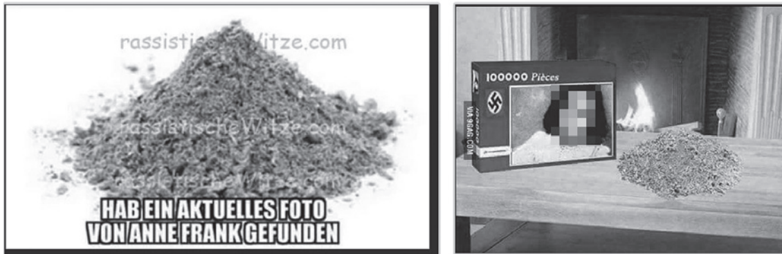
Figure 4: Memes building on the same idea can vary in the quality and intensity of their affect. Rhetorical design analysis allows us to identify the affect techniques that cause these differences.