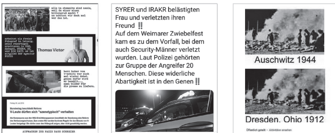
Figure 3: Memes that try to be convincing often use black-and-white images. When “alternative facts” are presented, they abandon design schemes from traditional journalism, suggesting “non-mainstream” sources instead. In other instances, design schemes from popular media outlets are imitated in order to emphasise the legitimacy of a claim.

freedom of speech with laws protecting individual rights and collective interests. These prohibit the coercion or denunciation of a person, depictions of extreme violence, and issuing any public call to commit criminal acts. The most significant difference between Swiss and German laws is the German prohibition of symbols of unconstitutional organisations (§86), including the National Socialist Party and its successor organisations. Using the swastika or Nazi propaganda imagery is thus explicitly forbidden under German law. More than a third of the memes reported feature forbidden symbols and/or Nazi propaganda imagery.